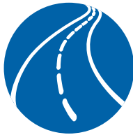
Voies de circulation et entrées des bâtiments de base