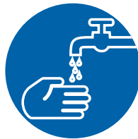
Installations sanitaires en dehors des aires rénovées