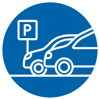
Places de stationnement

La définition de la portée de l'évaluation est essentielle pour déterminer quelles aires du site sont incluses et exclues de l'évaluation en vertu du Programme RHFAC. Puisque le Programme RHFAC adopte une approche holistique du parcours de l'utilisateur, toutes les aires dans lesquelles se déplaceront les utilisateurs et toutes les caractéristiques qu'ils utiliseront doivent faire partie de la portée de l'évaluation. Cela signifie que la portée de l'évaluation d'un site avec rénovations importantes peut comprendre plus que la rénovation importante, soit :